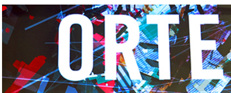
ORTE Architekturnetzwerk Niederösterreich