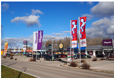
Gewerbepark Krems Ost

Für alle, die zu den Orten des Nachmittagsprogramms nicht individuell anreisen, steht ein kostenloser Shuttlebus zur Verfügung. Eine Anmeldung unter office@orte-noe.at ist erforderlich.