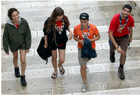
Die Stadt gehört uns