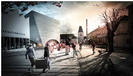
Das neue Kunstmuseum in Krems