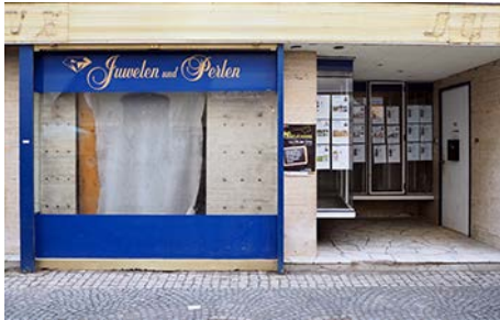
Leerstand in der Innenstadt