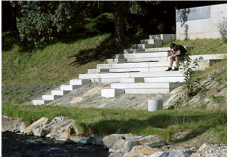
Gestalteter Hochwasserschutz an der Krems