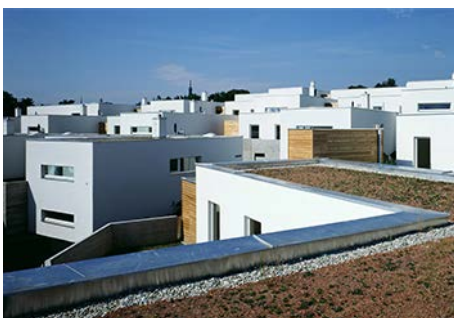
Wohnhausanlage am Hundssteig

Die Weltkulturerbe-Stadt Krems besitzt zahlreiche architektonische Denkmäler. Welche Herausforderungen stellen historische Bauten an ihre privaten EigentümerInnen? Gibt es ausreichend öffentliche Unterstützung für ihre Erhaltung und adäquate Nutzung? Architekt Ernst Linsberger führt durch die sanierten und unsanierten Teile von Schloss Gneixendorf und veranschaulicht den Schwierigkeitsgrad der Erhaltung historischer Bausubstanz.