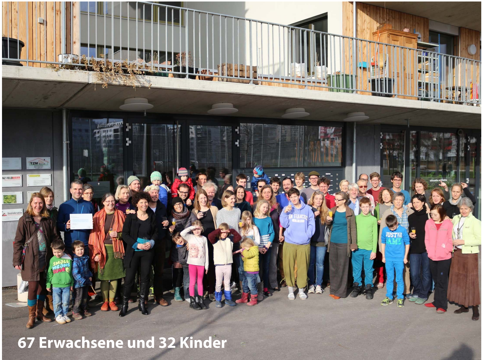
67 Erwachsene und 32 Kinder